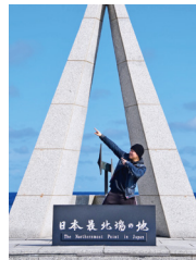
夏休みに北海道ツーリングの 際に宗谷岬で撮った写真です。