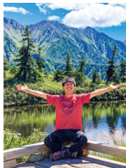
鏡池から眺める槍穂高連峰が とても綺麗でした。