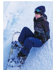
スノボ初心者。練習中です。