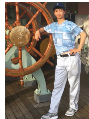
1か月の乗船実習に 行きました。