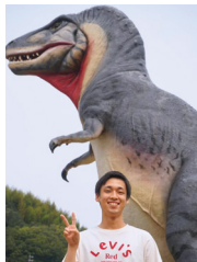
岡山県笠岡市の 恐竜公園に行きました。