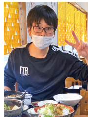
出張先で社属定食を 食べる前の写真です。