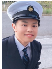
大阪港の天保山まつりに 行った時の写真です。