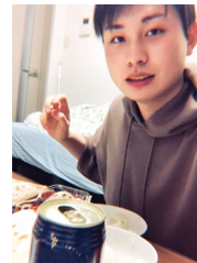
友人と宅飲みしています!