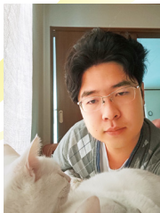
実家の猫にちょっかいを かけています。