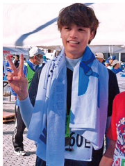
フルマラソンを完走した 直後です。