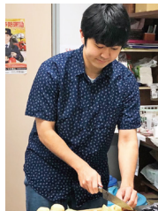
学生寮で友人とカレーを 作っています。