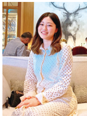
カフェ巡りが好きで、友達と アフタヌーンティーに行きました。